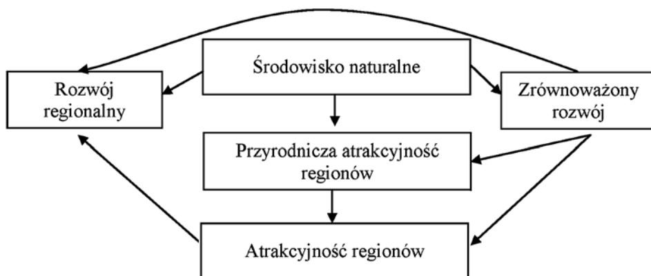
Rysunek 2. Struktura relacji pomiędzy środowiskiem, rozwojem regionalnym oraz rozwojem zrównoważonym a atrakcyjnością regionów