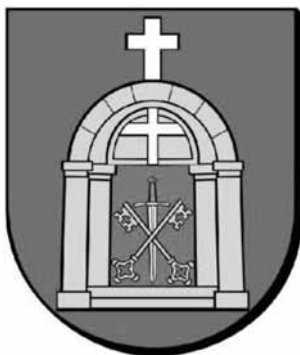
Rysunek 5. Herb Gminy Stare Miasto