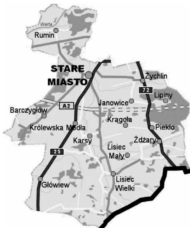
Rysunek 4. Obszar Gminy Stare Miasto