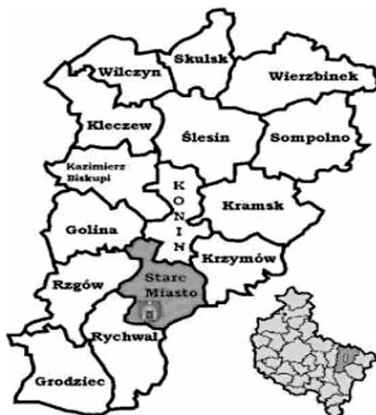
Rysunek 3. Gmina Stare Miasto na tle powiatu konińskiego