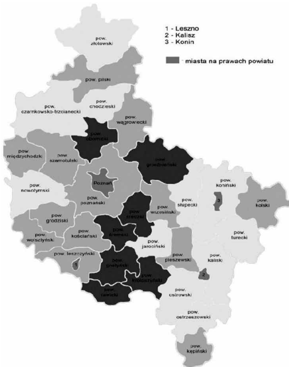
Rys. 1. Uwarunkowania zasobowe rolnictwa w Wielkopolsce względem powiatów (ujęcie lokalne)

Uwarunkowania zasobowe rolnictwa względem Wielkopolski: